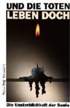
UND DIE TOTEN LEBEN DOCH Die Unsterblichkeit der Seele H-J. Ronsdorf - 240 Seiten - 7,90 €

Leben die Toten - oder ist der Tod das Ende alles Seins? Gibt es eine Unsterblichkeit der Seele oder sind Himmel und Hölle Relikte aus dem Mittelalter? Tote, die leben - die Bibel löst das Paradox und offenbart, dass der Tod nicht das Ende, sondern der Anfang eines Lebens ist, das nie mehr endet. Die Wahrheit dieser Aussage wird verbürgt durch eine Person, die starb und auferstand - Jesus Christus, der zurückkam aus dem Reich des Todes und den Weg öffnete, der ins Leben führt.