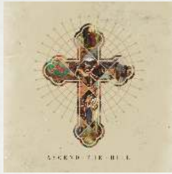
ASCEND THE HILL Ascend the Hill 13 Lieder - 8,99 €

Leben die Toten - oder ist der Tod das Ende alles Seins? Gibt es eine Unsterblichkeit der Seele oder sind Himmel und Hölle Relikte aus dem Mittelalter? Tote, die leben - die Bibel löst das Paradox und offenbart, dass der Tod nicht das Ende, sondern der Anfang eines Lebens ist, das nie mehr endet. Die Wahrheit dieser Aussage wird verbürgt durch eine Person, die starb und auferstand - Jesus Christus, der zurückkam aus dem Reich des Todes und den Weg öffnete, der ins Leben führt.